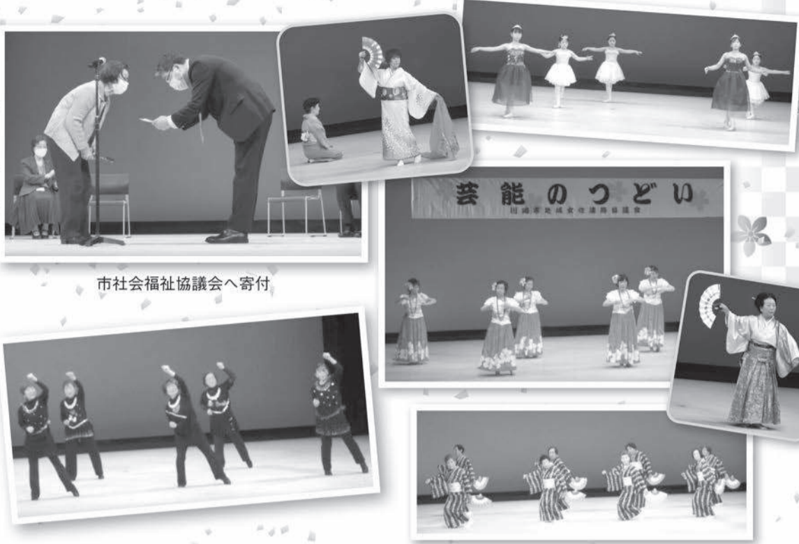
市社会福祉協議会へ寄付