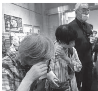
数万年前の気泡の音を聞く

が、一九五七年に昭和基地を開設後、隕石の大量発見、世界初のオゾンホール発見、南極の湖底に広がるコケボウズの発見など観測隊の成果があり、さらには二〇〇六年には深さ三千メートルの氷床採掘にも成功し、私たちが、数万年前の南極の氷に閉じ込められた気泡の音を聞くことができました。