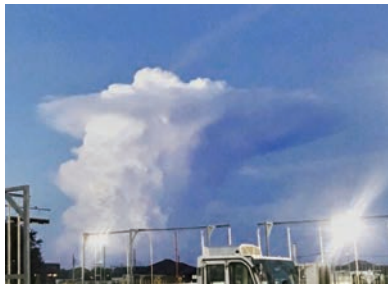
頂上部分が平らかなとこ雲の下は雷雨

ここ数年頻発している台風や集中豪雨が襲ってきた際の重要なポイントをお伝えします。まず警戒すべきは「積乱雲」です。頂上が平らな「かなとこ雲」が見えたら、その下は激しい雷雨の恐れがあります。