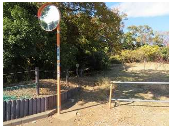
町田市・麻生区 境界