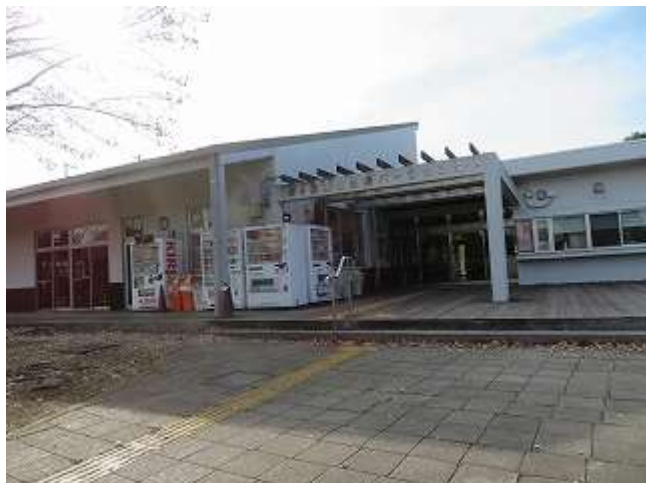
茅ヶ崎里山公園パークセンター