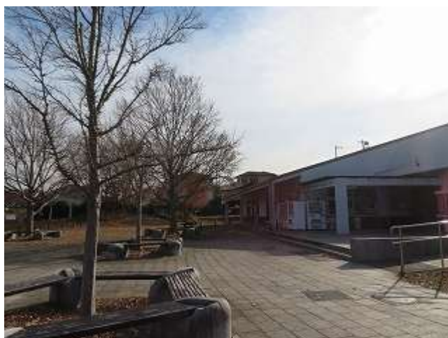
パークセンター（昼食）