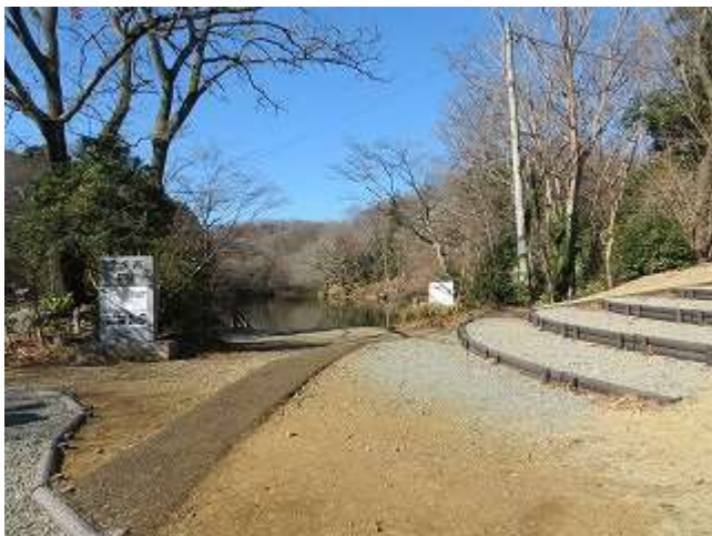
震生湖 (食事・休憩)