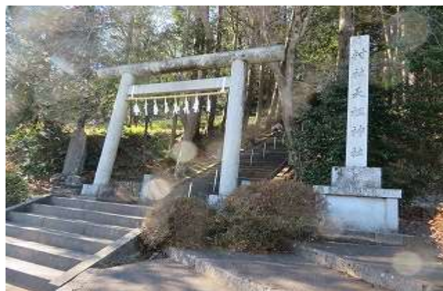
天祖神社鳥居 登り口