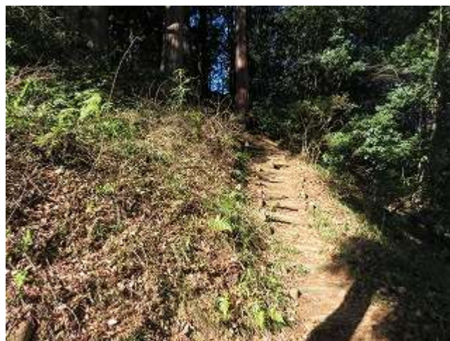
本殿右側から登る