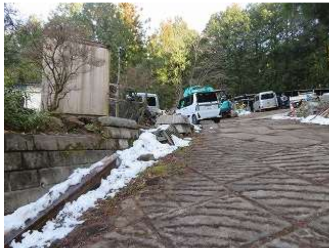
建材店の敷地を通る許可頂きました