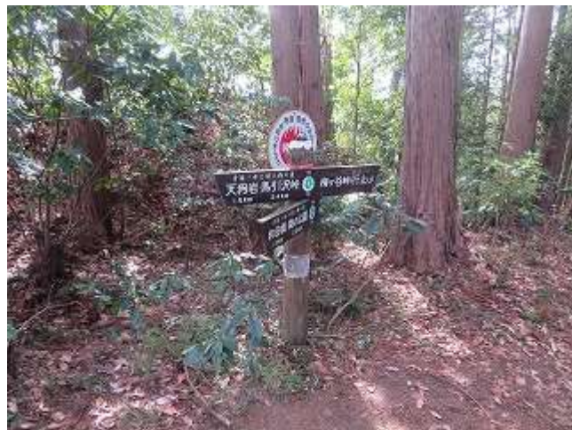
和田橋・梅の公園への分岐