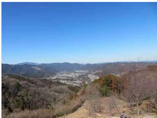
赤ぼっこから青梅の町