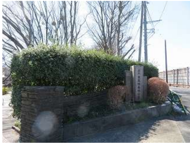
東高根新林公園北口