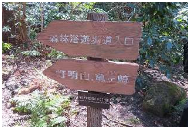
森林遊歩道出入口