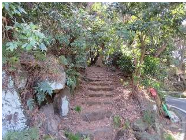
森林浴遊歩道入口