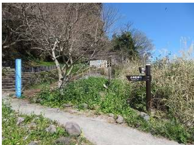
ケープ真鶴の登り口