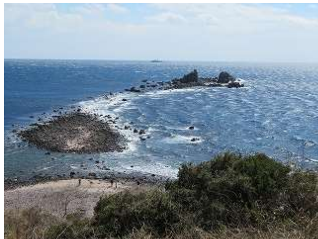
高台からの三ツ石