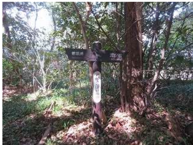
森林遊歩道 灯明山