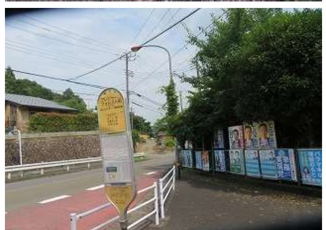
バス停=相模湖駅 係 濱坂