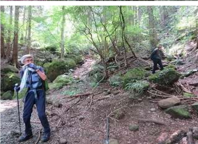
東海自然歩道下山口 車道 真夏のような暑さで嵐山の登り中止にしました。