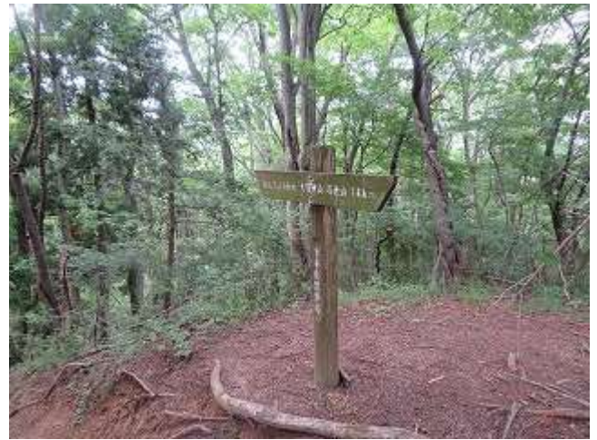
東海自然歩道・チャレンジコース分岐