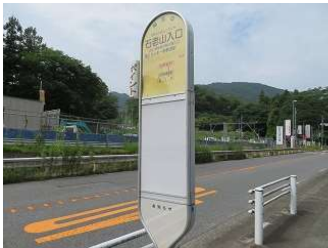
石老山登山口バス停

コース： バス9時発＝石老山登山口200m9:11→相模湖病気9:26→顕鏡寺9:51→桜山展望台10:15→融合平見晴台10:53→石老山△693m11:37～12:03(昼食)→大明神551m12:56→大明神展望台13:05→分岐→東海自然歩道13:09→車道13:49→フォレスト前バス停14:20(解散)＝相模湖駅