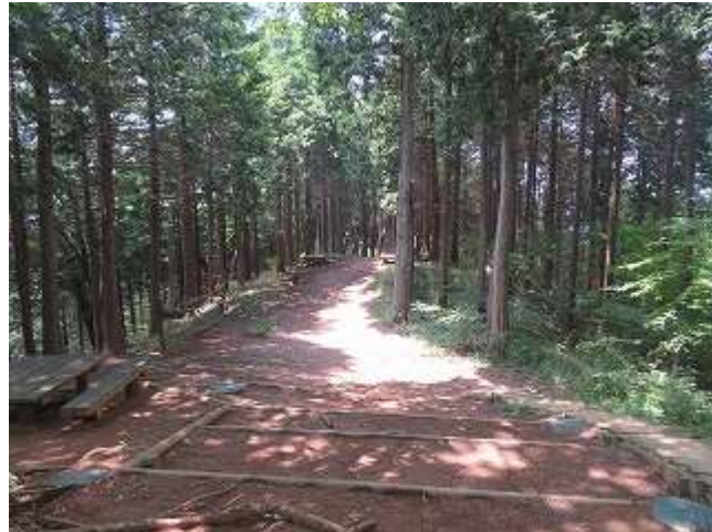
大明神への登山道