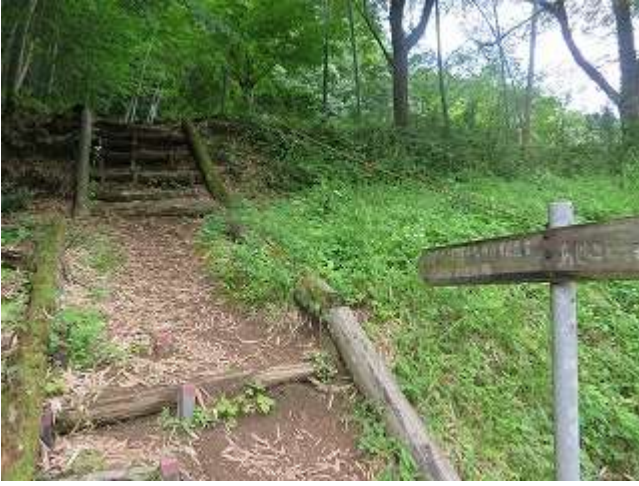
山抱きの大樫入口