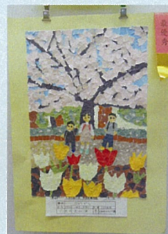
作品展「ちぎり絵の部」