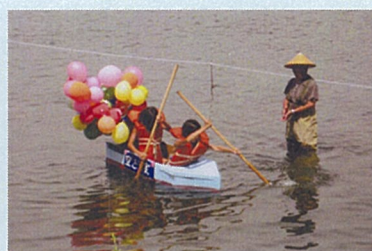
多摩川どろぶね競争