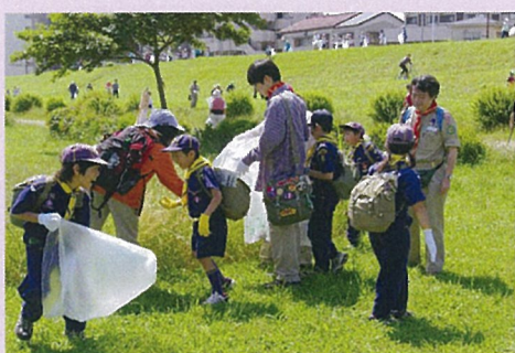
多摩川美化清掃活動