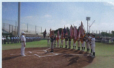
真夏の少年野球大会