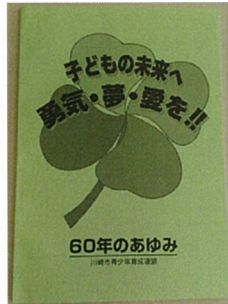
60周年のあゆみ 2007年12月3日発行