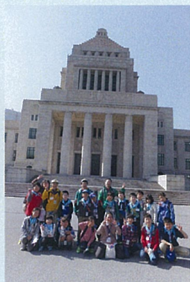
国会議事堂見学ツアー