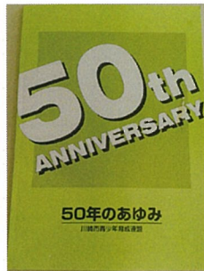
50周年のあゆみ 1997年2月22日発行