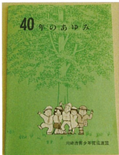
40周年のあゆみ 1987年3月22日発行

川崎市青少年育成連盟では40周年以降、10年ごとの節目に記念事業の一つとして記念誌を発行しており、今回の70周年にあたりまして平成29年3月31日に発行いたしました。詳細は事務局までお問い合わせください。