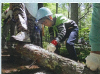
八ヶ岳宿泊研修伐体験