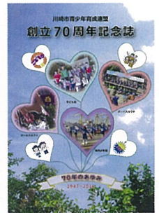
70周年のあゆみ 2017年3月31日発行

発行 川崎市青少年育成連盟 事務局 〒213-0001 高津区溝口1-6-10 生活文化会館（てくのかわさき）3階 TEL 044-811-2125 FAX 044-811-2126