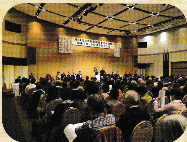
日視連関東ブロック協議会 川崎大会