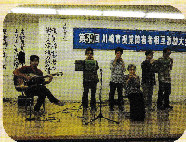
相互激励大会での演芸